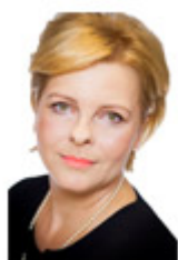
Ast ram owi cz- Ley k Ter esa

e- mail : jolanta. and rusz kie wicz @w arm ia.m azur y.pl