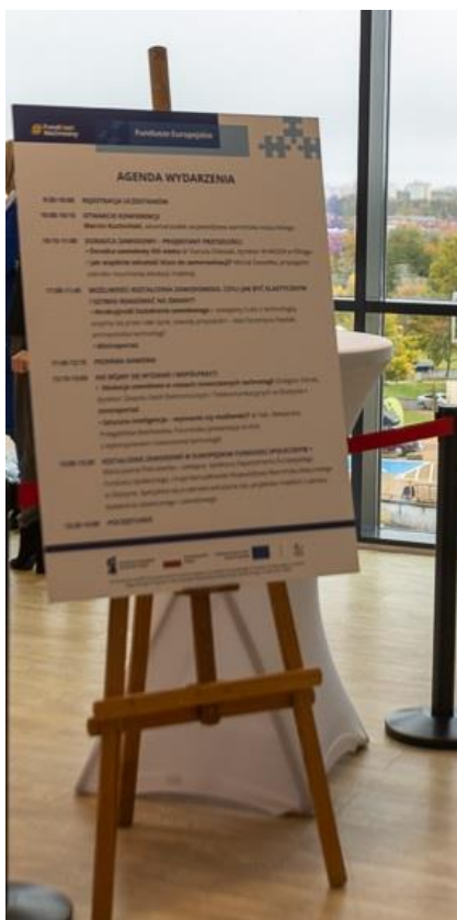
Zdjęcie poglądowe przykładowej planszy B1 z programem konferencji.

Uwaga 4: Wykonawca zapewni co najmniej dwie plansze wielkości formatu B1 , które będą ustawione (np. na sztalugach) przy punkcie rejestracyjnym oraz wejściu na salę konferencyjną, na których będzie zaprezentowany program przebiegu konferencji, wygenerowany kod QR który będzie odsyłał do informacji o konferencji. Wszystkie projekty wizualizacji wymagają zatwierdzenia Zamawiającego. Wykonawca jest odpowiedzialny za produkcję, dostarczenie na miejsce konferencji oraz odpowiednie wyeksponowanie obydwu plansz.