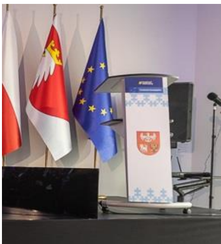
Zdjęcie poglądowe przykładowej tablicy na mównicy.