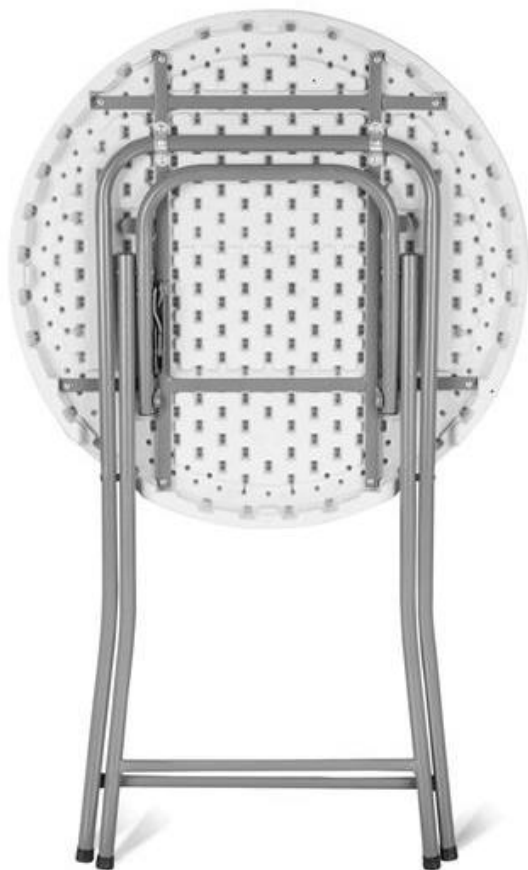
Zdjęcie nr 12