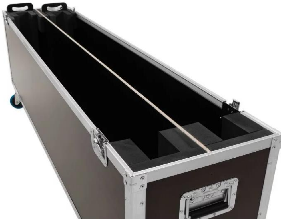
Zdjęcie nr 10