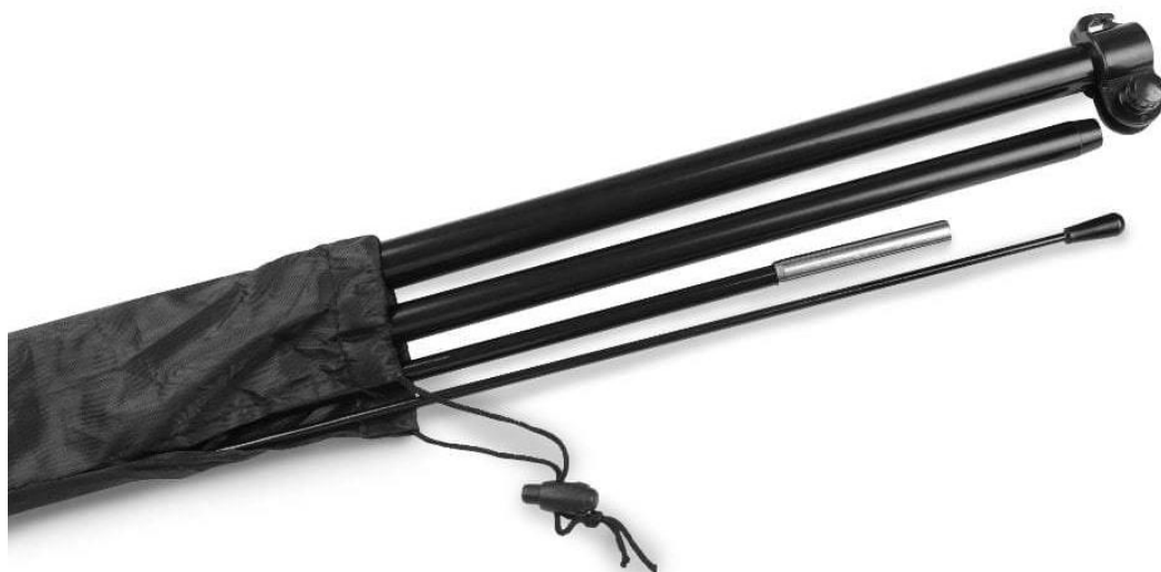
Zdjęcie nr 6