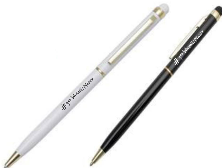
Zdjęcie poglądowe nr 2