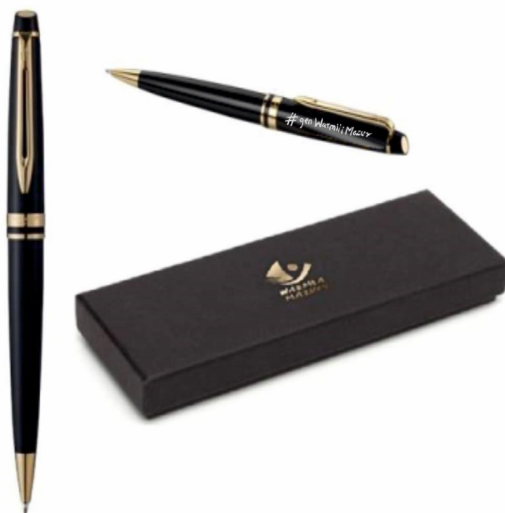
Zdjęcie poglądowe nr 4