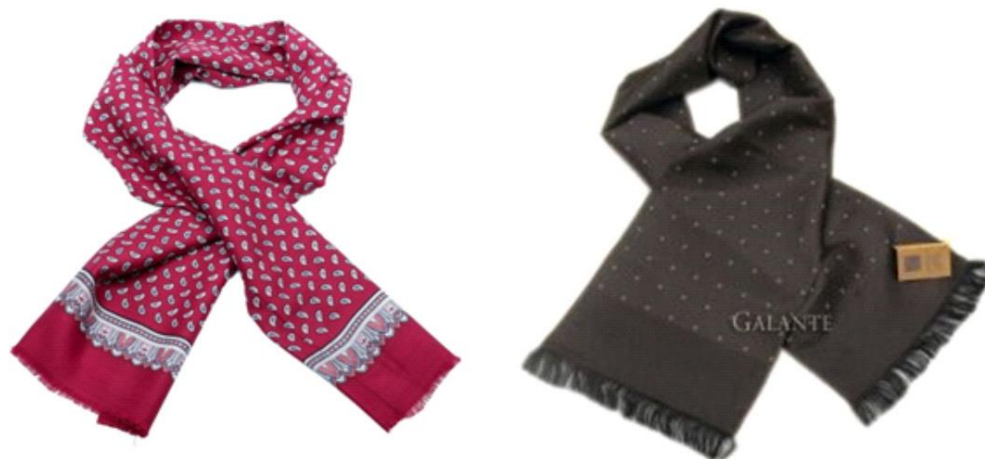
Zdjęcie nr 7