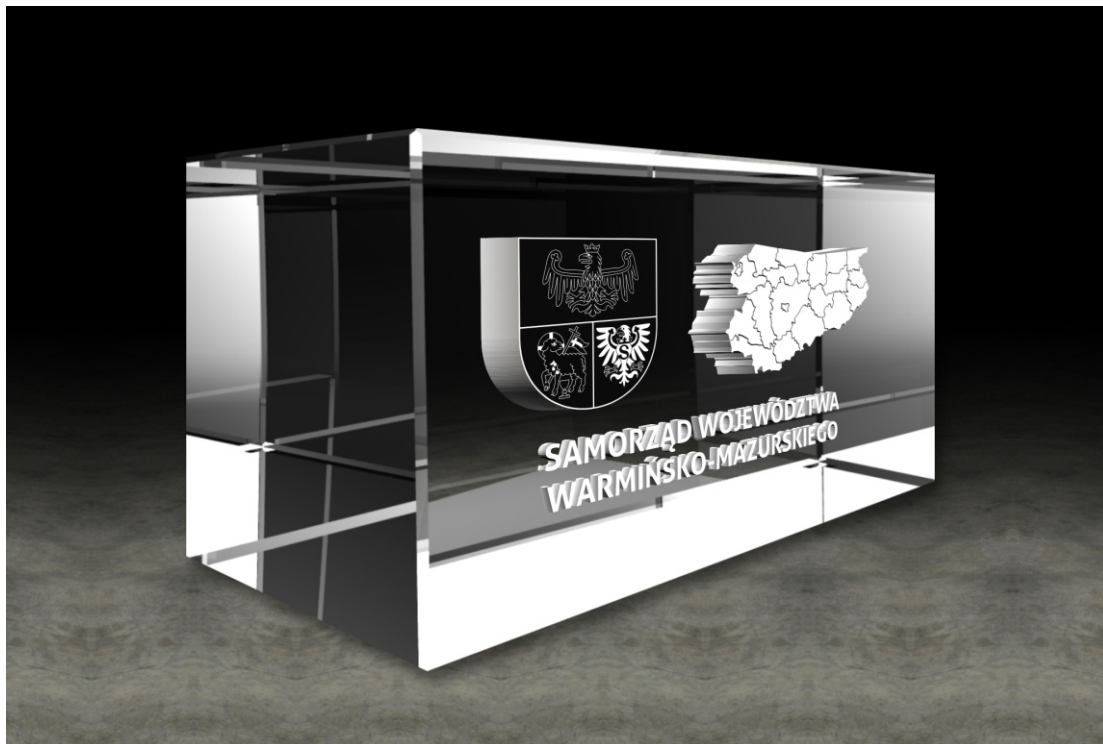
Poglądowa wizualizacja statuetki