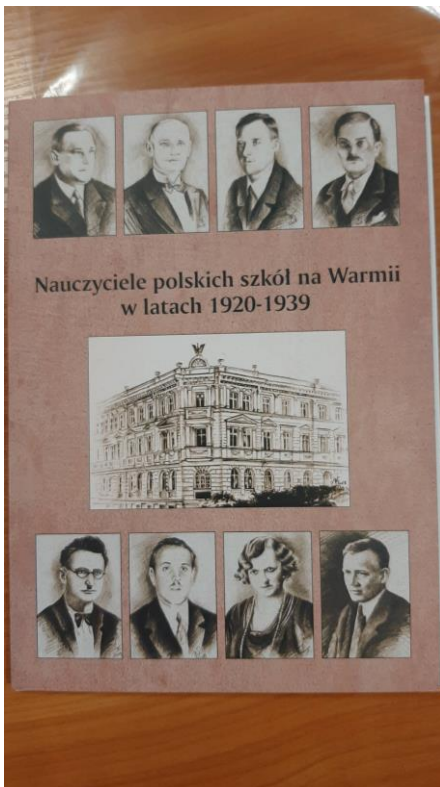
Zdjęcie nr 3 i 3a