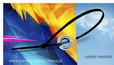
montaż naszych banerów jest niezwykle prosty i do tego bardzo szybki

http://www.banery-czestochowa.pl/baner-dwustronny