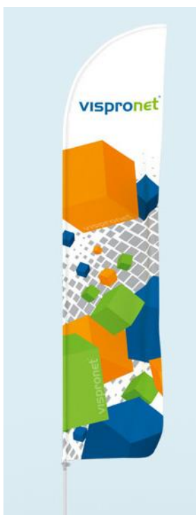
Zdjęcie nr 12

https://www.vispronet.pl/bowflag/bowflag-select/tube/bowflag-select-tube-prosty/