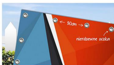
zaoczkowany, zastosowane przez nas elementy nie rdzewieją