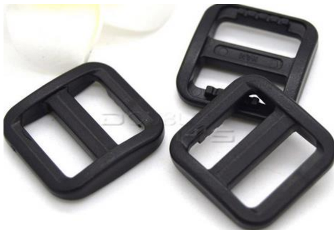
Zdjęcie nr 11

https://pl.aliexpress.com/item/500pcs-lot-5-8-15mm-Slider-Tri-Glide-Adjust-Plastic-Buckles-For-Dog-Collar-Harness-Backpack/32656588430.html