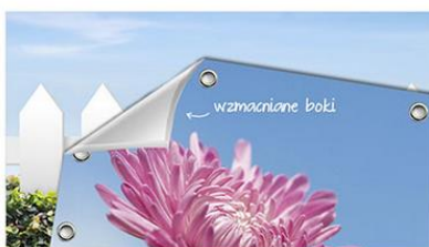
wytrzymały - baner ma zgrzane boki i jest drukowany w jednym kawałku, co wpływa na jego wytrzymałość