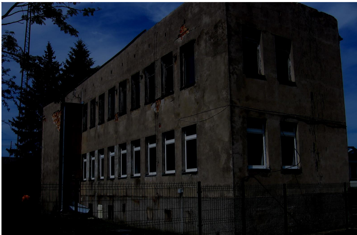
Widok budynku od strony południowej