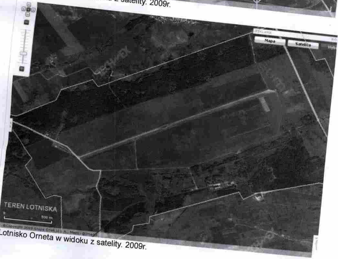
Lotnisko Orneto w widoku z satelity. 2009r.