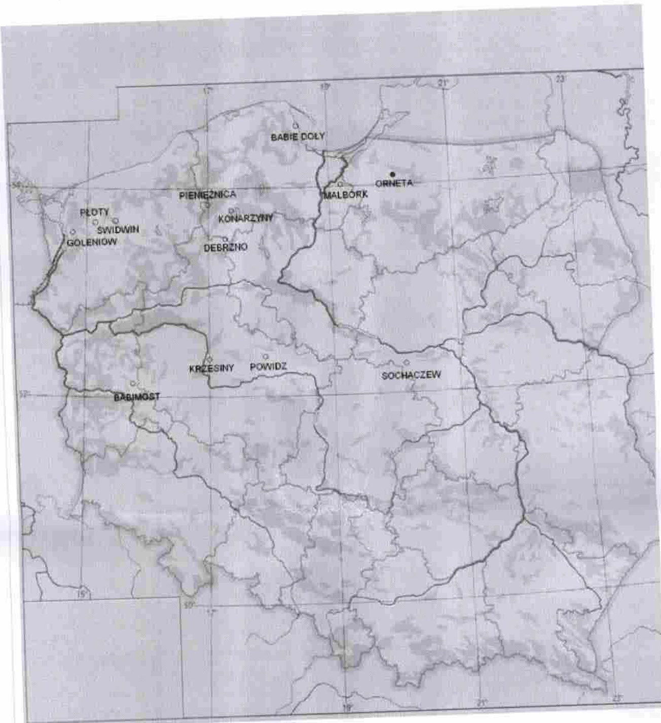
Lotnisko Orneka na Mapie Polski. 2009r.