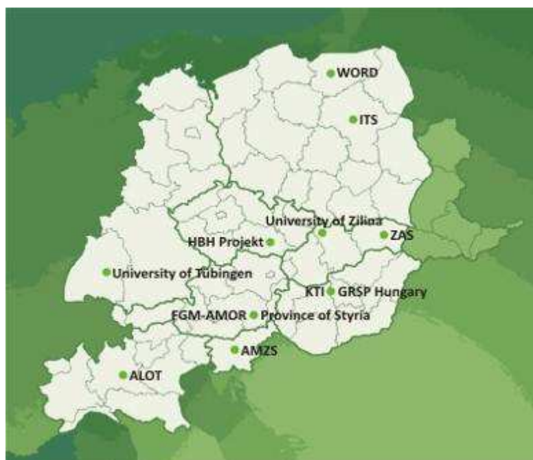
Rys. Partnerzy międzynarodowego Projektu SOL (Save Our Lives)

Prace prowadzone przez WORD – Regionalne Centrum BRD miały na celu opracowanie strategii i planów działań nakierowanych na wybrane problemy bezpieczeństwa ruchu drogowego w obszarach pilotażowych. Bazując na utworzonych strukturach roboczych zespołów lokalnych opracowane zostały miejskie strategie poprawy brd w Barczewie, Olsztynie i Nidzicy oraz lokalne plany działań związane z rozwiązywaniem problemów: obrażeń dzieci w ruchu drogowym, nadmiernej prędkości oraz jazdy pod wpływem alkoholu. Prace te realizowano poprzez konsultacje, spotkania i wizyty robocze w miastach pilotażowych, a przede wszystkim przez kolejne warsztaty organizowane zgodnie z harmonogramem projektu. W okresie od stycznia do czerwca 2013 r. w ramach projektu SOL w regionie, zrealizowano m.in.: