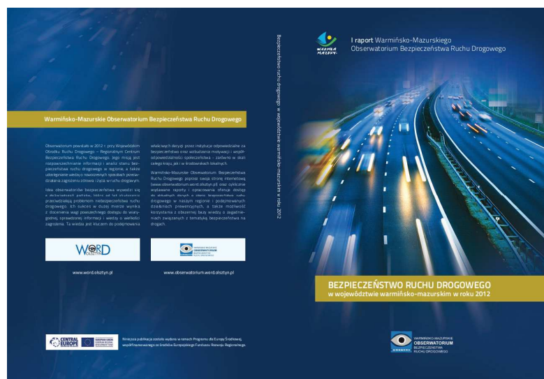
fol. I Raport Warmińsko-Mazurskiego Obserwatorium Bezpieczeństwa Ruchu Drogowego

W dniu 13 czerwca 2013 r. zaprezentowany został I Raport Warmińsko-Mazurskiego Obserwatorium Bezpieczeństwa Ruchu Drogowego . Stanowi on integralną część systemowych prac prowadzonych przez Regionalne Centrum Bezpieczeństwa Ruchu Drogowego w Olsztynie i mieszczące się w nim Obserwatorium. Raport ma na celu prezentację zagrożeń w ruchu drogowym na Warmii i Mazurach; począwszy od porównania regionu do sytuacji w kraju, poprzez szczegółową analizę stanu bezpieczeństwa na poziomie województwa, aż po problematykę bezpieczeństwa w poszczególnych powiatach.