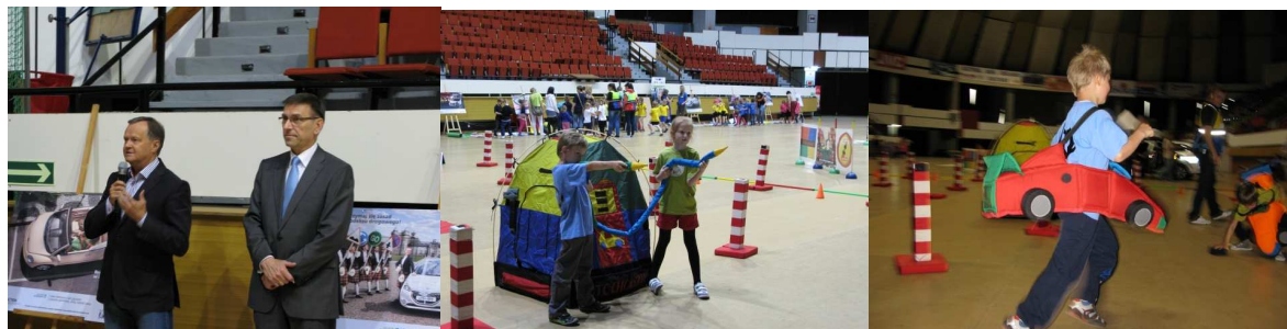
Fot. AUTORIADA – podsumowanie tegorocznej edycji Programu w hali Urania