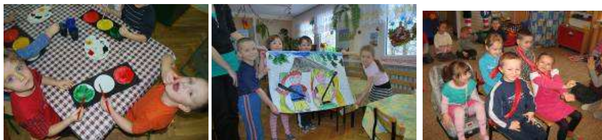
Fot. Akcja „ZZ” w przedszkolach