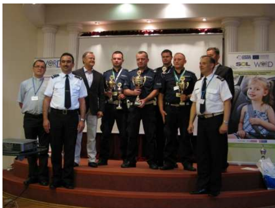
fot. Zwycięzcy turnieju wojewódzkiego "Policjant Ruchu Drogowego 2013", w środku zwycięzca indywidualny.

Konferencja zakończyła się żywą dyskusją na temat stanu bezpieczeństwa ruchu drogowego i koniecznych działaniach prewencyjnych, zwłaszcza w obszarze największych zagrożeń: nadmiernej prędkości, niebezpiecznego otoczenia dróg (drzewa) oraz problemu nietrzeźwych uczestników ruchu drogowego. W obecności uczestników uroczystie wręczono też nagrody zwycięzcom odbywającego się równolegle finału wojewódzkiego konkursu „Policjant Ruchu Drogowego”.