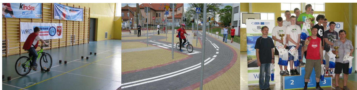
Fot. Migawki z Finału Wojewódzkiego Turnieju BRD w Węgorzewie 2013

Na etapie szkolnym i powiatowym wzięło udział około 40.000 uczniów natomiast w finale wojewódzkim obu finałów (dla szkół podstawowych, dla gimnazjów) zostało zgłoszonych 18 trzyosobowych drużyn.