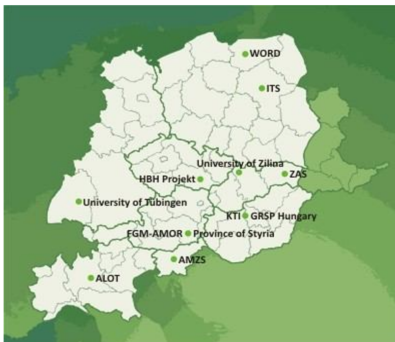
Rys. Partnerzy międzynarodowego Projektu SOL (Save Our Lives)

Projekt SOL – „Save Our Lives” ma na celu wzmocnienie potencjału lokalnych i regionalnych partnerów w działaniach, których celem jest szeroko pojęte zapobieganie wypadkom drogowym w Europie Środkowej. Jest to 3 letni projekt, który został uruchomiony w kwietniu 2010 r. Partnerzy projektu z 7 krajów Europy Środkowej mają za zadanie wdrożyć skuteczne programy budowy regionalnej i międzynarodowej sieci bezpieczeństwa ruchu drogowego. Projekt "SOL - Save Our Lives" jest współfinansowany przez Europejski Fundusz Rozwoju Regionalnego (EFRR). Jednym z dwóch krajowych partnerów projektu został WORD - Regionalne Centrum BRD w Olsztynie.