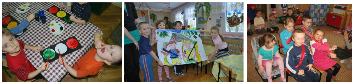
Fot. Akcja „ZZ” w przedszkolach