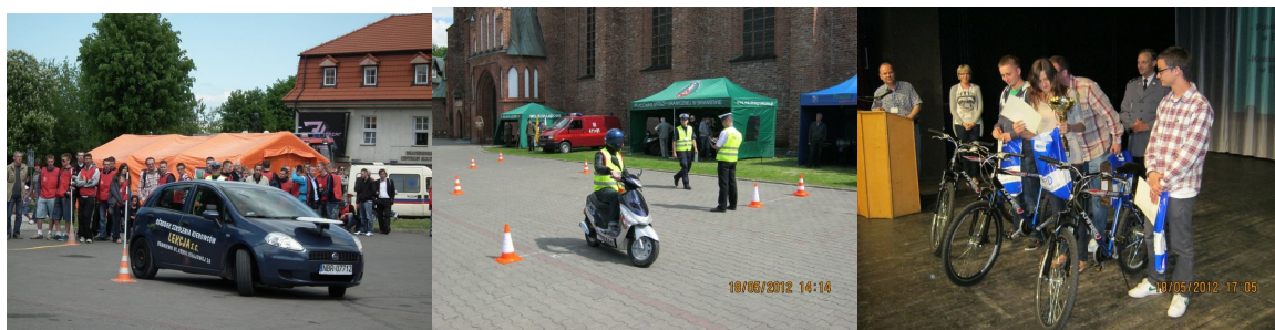
Fot. Migawki z Finału Wojewódzkiego Turnieju Motoryzacyjnego w Braniewie 2012

WORD Olsztyn oraz WORD Elbląg był także organizatorem Warmińsko - Mazurskiego Młodzieżowego Turnieju Motoryzacyjnego 2012. Turniej ten skierowany jest do uczniów szkół ponadgimnazjalnych. Drużyny rywalizują w konkurencjach: test z przepisów ruchu drogowego i historii motoryzacji, udzielanie pierwszej pomocy, jazda sprawnościowa motorowerem oraz jazda sprawnościowa z „Talerzem Stewarda”. Finał Wojewódzki Turnieju został zorganizowany w dniu 18 maja br. na terenie Zespołu Szkół Zawodowych im. Jana Liszewskiego w Braniewie oraz na Placu przy Bazylice św. Katarzyny Aleksandryjskiej. W finale uczestniczyło 19 drużyn. Co roku na etapie szkolnym w Turnieju uczestniczy około 10.000 uczniów szkół ponadgimnazjalnych z województwa warmińsko – mazurskiego.