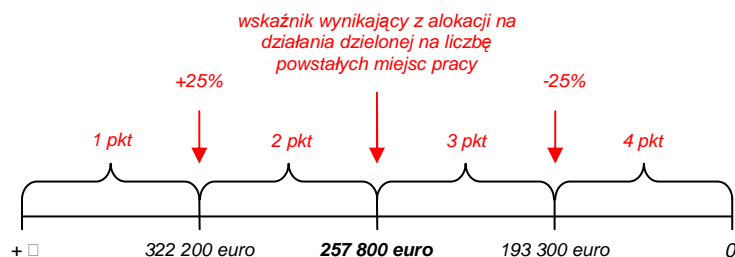
Rysunek 1. Sposób określania punktów za kryterium 'Koszt utworzenia 1 miejsca pracy' dla całej osi 'Turystyka'.