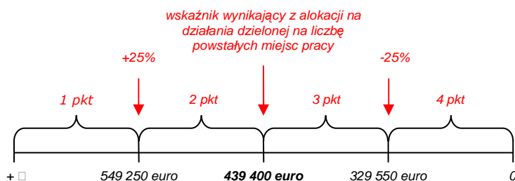
Rysunek 2. Sposób określania punktów za kryterium 'Koszt utworzenia 1 miejsca pracy' dla całej osi 'Rozwój, restrukturyzacja i rewitalizacja miast'.