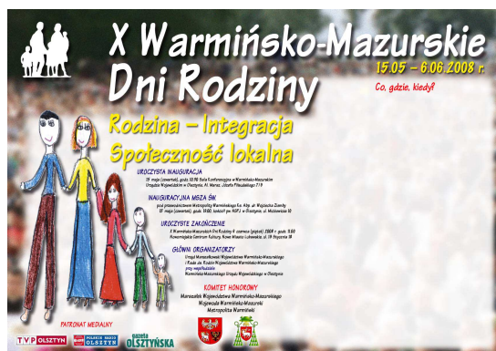
Rycina nr 3

Dni Rodziny promowane były poprzez poniższy okolicznościowy plakat, którego wydanie sfinansował Urząd Marszałkowski Województwa Warmińsko-Mazurskiego.