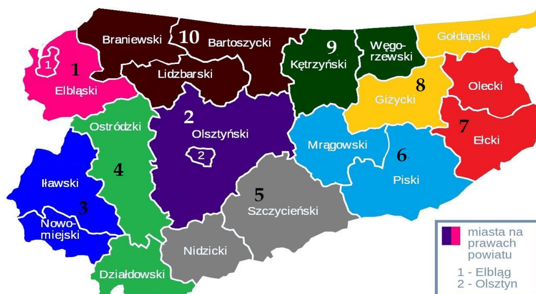
Wykres nr 1 Podział województwa warmińsko-mazurskiego na regiony operacyjne.