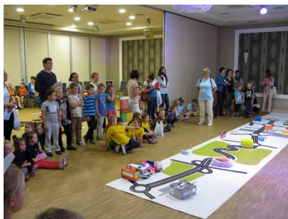
Fot. AUTORIADA – podsumowanie tegorocznej edycji Programu w obiekcie ERANOVA