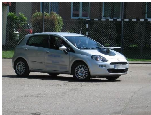
Fot. Wojewódzki Turniej Motoryzacyjny - finał w Bartoszychach, 23 maja 2014