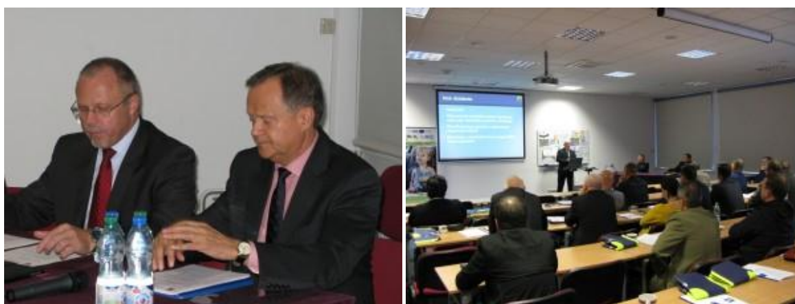
fot. Posiedzenie WRBRD w dniu 20 października 2014 r.

Podczas kolejnego posiedzenia Warmińsko – Mazurskiej Wojewódzkiej Rady Bezpieczeństwa Ruchu Drogowego, które odbyło się w dniu 20.10.2014 r. przyjęta została Uchwała zatwierdzająca aktualną, Warmińsko Mazurską Strategię Bezpieczeństwa Ruchu Drogowego na lata 2014 – 2020. Uwzględniając aktualne uwarunkowania europejskiej i krajowej polityki transportowej, przyjęty dokument jest kluczowym narzędziem regionalnego systemu zarządzania bezpieczeństwem ruchu drogowego, stanowi także kontynuację wieloletnich działań związanych z realizacją poprzedniego programu wojewódzkiego pn. „GAMBIT Warmińsko – Mazurski”. Dodatkowo, w trakcie spotkania zaprezentowane zostały informacje dotyczące stanu bezpieczeństwa na drogach województwa za 9 miesięcy roku 2014, a także założenia i pierwsze efekty programów profilaktycznych realizowanych przez Zarząd Dróg Wojewódzkich w Olsztynie i Wydział Ruchu Drogowego Komendy Wojewódzkiej Policji w Olsztynie.