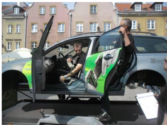
Dzień Bezpiecznego Kierowcy w Olsztynie 25.07.2014