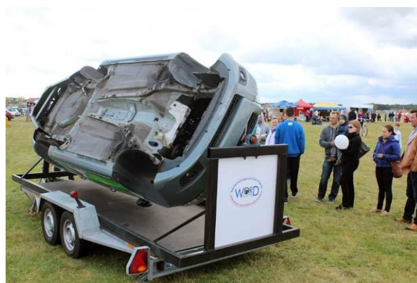
Bezpieczni – Ja, Ty, My – Bezpieczne Wakacje 2014” 14.06.2014 Osiedle Dajtki