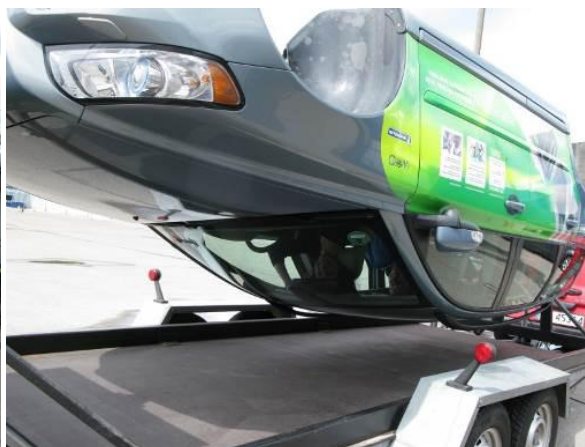
Majówka Rotary Club Olsztyn 11.05.2014