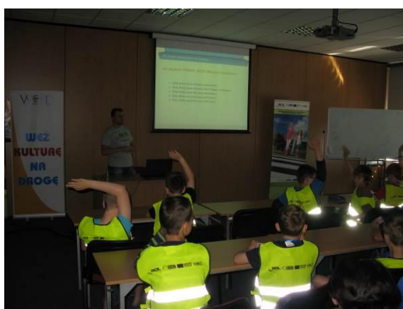
Fot. Uniwersytet Dzieci - spotkania edukacyjne, 23 maja 2014