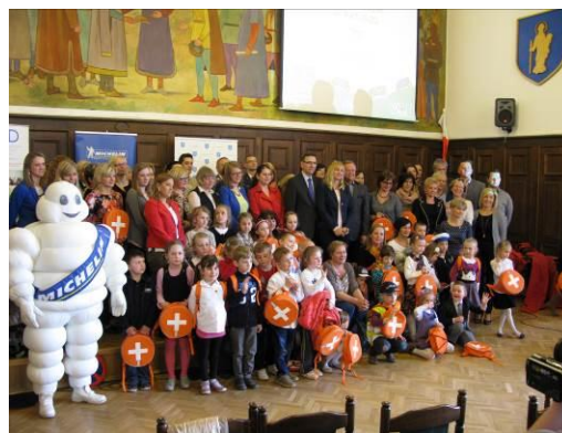
Fot. Jubileusz w Ratuszu – podsumowanie 5 lat Programu, 10.05.2014