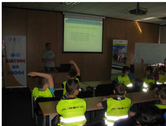
Fot. Uniwersytet Dzieci - spotkania edukacyjne, 23 maja 2014