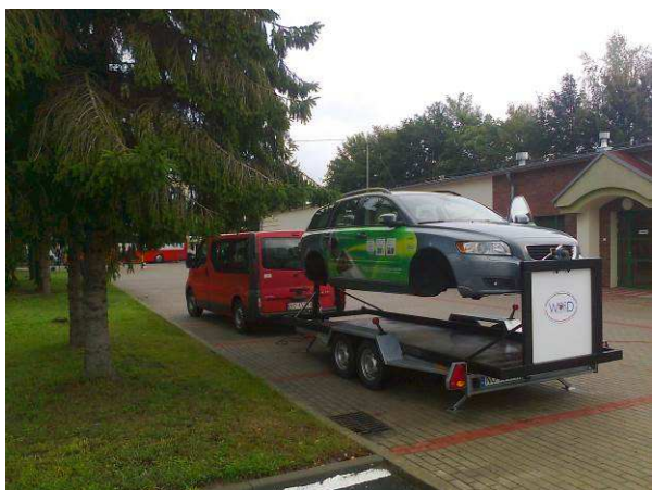
Majówka Rotary Club Olsztyn 11.05.2014