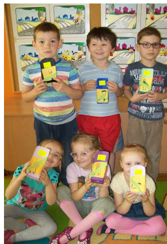
Przedszkole w Tolkmicku – Akcja Zawsze Zapinam