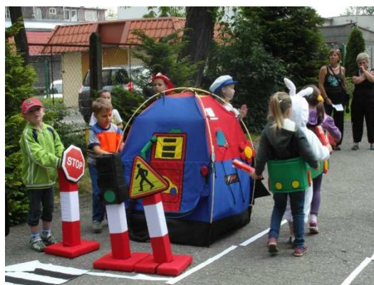
Przedszkole Nr 8 w Elblągu