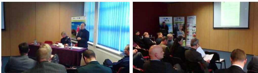
Posiedzenie WRBRD w dniu 4 stycznia 2013 r.