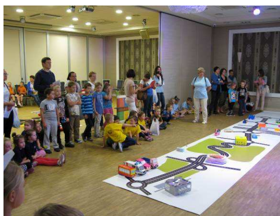
podsumowanie tegorocznej edycji Programu w hali Urania