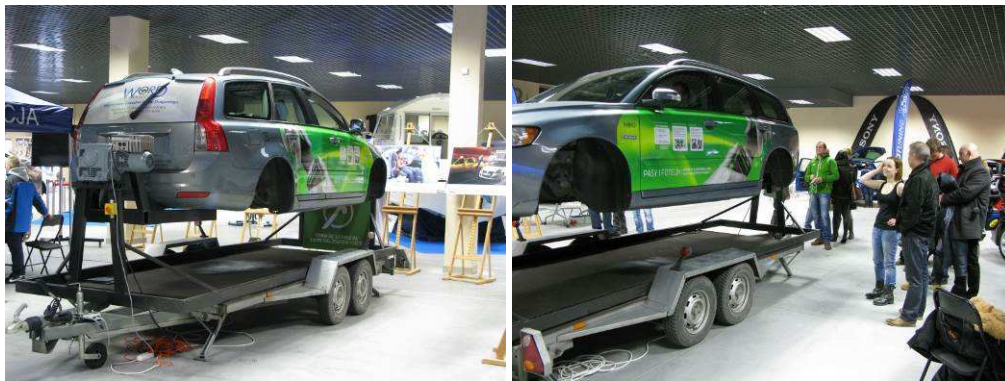
Dni Otwarte WORD Olsztyn 15.05.2014