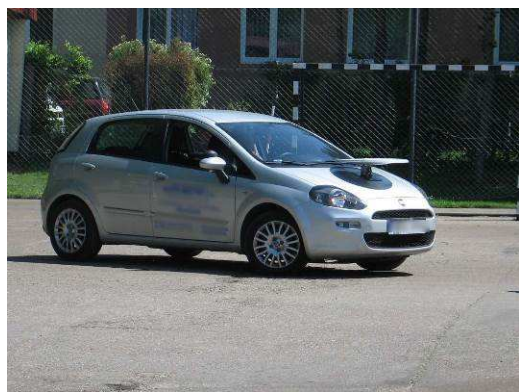
Fot. Wojewódzki Turniej Motoryzacyjny - finał w Bartoszycach, 23 maja 2014