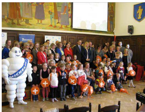
Fot. Jubileusz w Ratuszu – podsumowanie 5 lat Programu, 10.05.2014