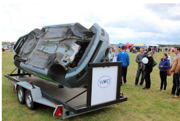
Bezpieczni – Ja, Ty, My – Bezpieczne Wakacje 2014” 14.06.2014 Osiedle Dajtki