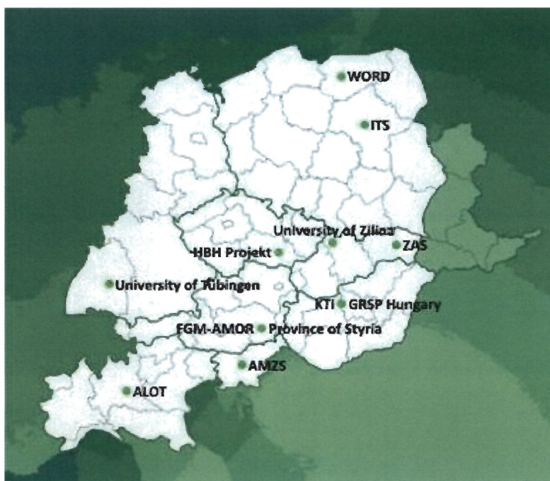
Rys. Partnerzy międzynarodowego Projektu SOL (Save Our Lives)

Projekt SOL – „Save Our Lives” miał na celu wzmocnienie potencjału lokalnych i regionalnych partnerów w działaniach, których celem jest szeroko pojęte zapobieganie wypadkom drogowym w Europie Środkowej. Był to 3 letni projekt, rozpoczęty w kwietniu 2010 r. Partnerzy projektu z 7 krajów Europy Środkowej mieli za zadanie wdrożyć skuteczne programy budowy regionalnej i międzynarodowej sieci bezpieczeństwa ruchu drogowego. Projekt "SOL - Save Our Lives" był współfinansowany przez Europejski Fundusz Rozwoju Regionalnego (EFRR). Jednym z dwóch krajowych partnerów projektu był WORD w Olsztynie.