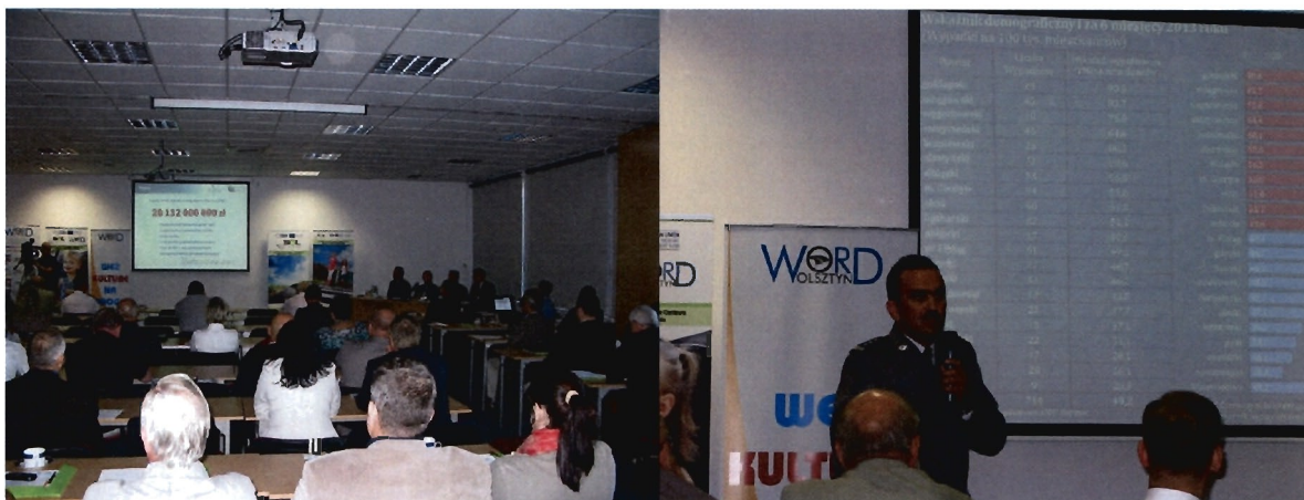
fot. Posiedzenie WRBRD w dniu 4 stycznia 2013 r.

W dniu 9 września 2013 r., w sali konferencyjnej Wojewódzkiego Ośrodka Ruchu Drogowego – Regionalnego Centrum Bezpieczeństwa Ruchu Drogowego w Olsztynie, odbyło się kolejne posiedzenie Warmińsko – Mazurskiej Wojewódzkiej Rady Bezpieczeństwa Ruchu Drogowego.