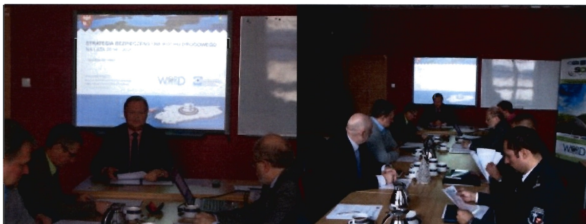
fot. Spotkanie dotyczące Strategii w WORD – Regionalnym Centrum BRD w Olsztynie

Podczas spotkania przedstawiciele instytucji szczególnie zaangażowanych w proces poprawy brd w regionie, ustalono wstępny harmonogram prac, główne założenia dokumentu, a także zaprezentowano syntetyczną diagnozę bezpieczeństwa ruchu drogowego opracowaną na podstawie danych o wypadkach drogowych za lata 2008 – 2012. Zgodnie z przyjętym harmonogramem, na posiedzeniu Wojewódzkiej Rady BRD w dniu 5 lutego 2014 r. zaprezentowane zostaną założenia dokumentu, a ostateczna wersja opracowania powinna zostać przyjęta uchwałą Sejmiku Województwa w I połowie 2014 r.