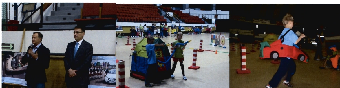
Fot. AUTORIADA – podsumowanie tegorocznej edycji Programu w hali Urania