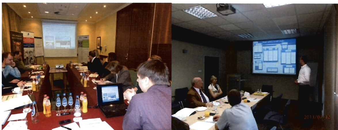
fot. Spotkania partnerów projektu

Na zaproszenie węgierskiego Instytutu Transportu (KTI), WORD Olsztyn został włączony do grona partnerów realizujących projekt pod nazwą PRO – SAFE. Projekt realizowany będzie w roku 2013 przy udziale 5 instytucji z 4 krajów Grupy Wyszehradzkiej. Podstawowym założeniem projektu jest poprawa współpracy w zakresie działań ukierunkowanych na bezpieczeństwo ruchu drogowego w krajach Grupy, a także polepszenie koordynacji działań na rzecz bezpieczeństwa transportu drogowego. Partnerami projektu poza KTI i WORD Olsztyn są: Instytut Transportu Samochodowego w Warszawie, Uniwersytet w Żylinie oraz czeskie Centrum Badań Transportu. W ramach projektu odbyły się trzy konferencje/spotkania Partnerów: w dniu 8.03.2013 r. w Warszawie, w dniu 12.07.2013 r. w Budapeszcie oraz 6.12.2013 r. w Żylinie.