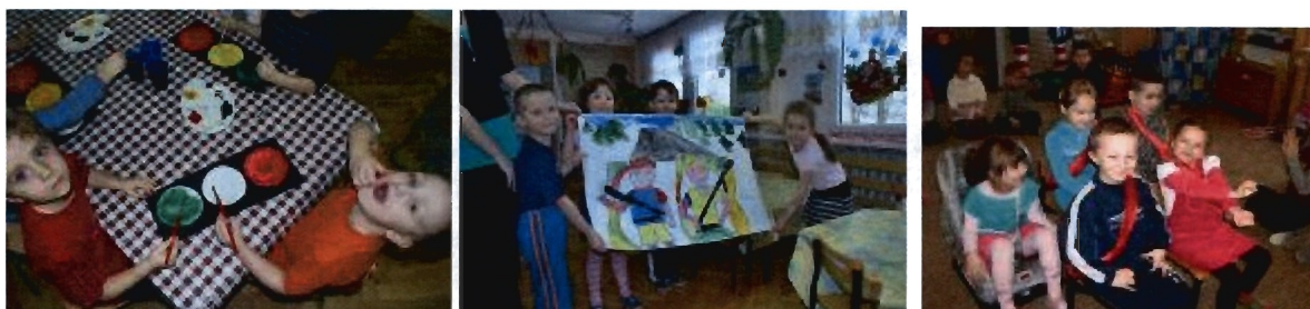
Fot. Akcja „ZZ” w przedszkolach

3/ akcja miejska – ZZ jako nawyk zapinania pasów przez wszystkich. Dzieci uczą dorosłych – kampania zewnętrzna