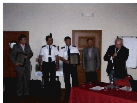
Mapa bezpieczeństwa w województwie warmińsko - mazurskim oraz wręczenie pamiątkowych tablic przedstawicielom powiatu piskiego.