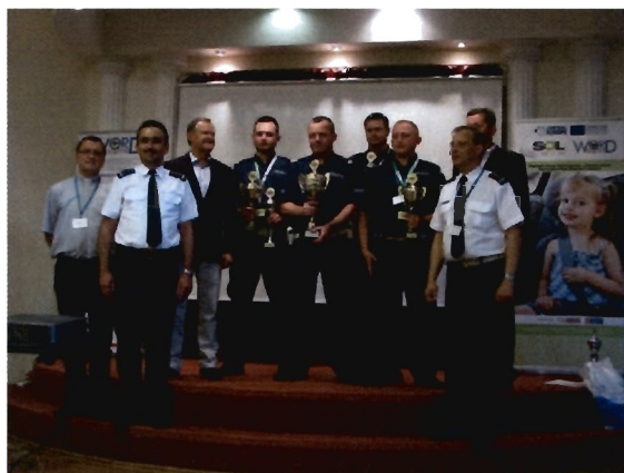
fot. Zwycięzcy turnieju wojewódzkiego "Policjant Ruchu Drogowego 2013", w środku zwycięzca indywidualny.

Konferencja zakończyła się żywą dyskusją na temat stanu bezpieczeństwa ruchu drogowego i koniecznych działaniach prewencyjnych, zwłaszcza w obszarze największych zagrożeń: nadmiernej prędkości, niebezpiecznego otoczenia dróg (drzewa) oraz problemu nietrzeźwych uczestników ruchu drogowego. W obecności uczestników uroczystie wręczono też nagrody zwycięzcom odbywającego się równolegle finału wojewódzkiego konkursu „Policjant Ruchu Drogowego”.