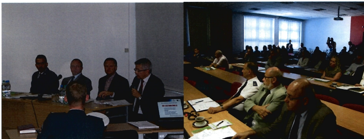
fol. Posiedzenie WRBRD w dniu 9 września 2013 r.