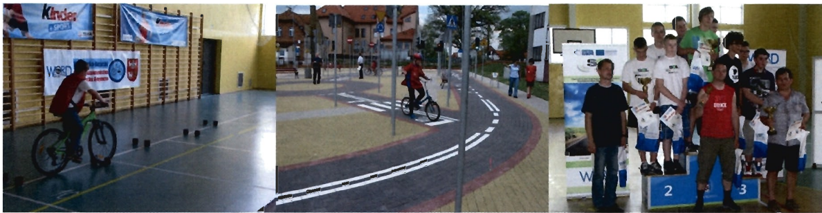
Fot. Migawki z Finału Wojewódzkiego Turnieju BRD w Węgorzewie 2013

WORD Olsztyn oraz WORD Elbląg byli także organizatorami Warmińsko - Mazurskiego Młodzieżowego Turnieju Motoryzacyjnego 2013. Turniej ten skierowany jest do uczniów szkół ponadgimnazjalnych. Drużyny rywalizują w konkurencjach: test z przepisów ruchu drogowego i historii motoryzacji, udzielanie pierwszej pomocy, jazda sprawnościowa motorowerem oraz jazda sprawnościowa z „Talerzem Stewarda”. Finał Wojewódzkiego Turnieju został zorganizowany w dniu 24 maja br. na terenie Wojewódzkiego Ośrodka Ruchu Drogowego w Elblągu. Co roku na etapie szkolnym w Turnieju uczestniczy około 10.000 uczniów szkół ponadgimnazjalnych z województwa warmińsko – mazurskiego.